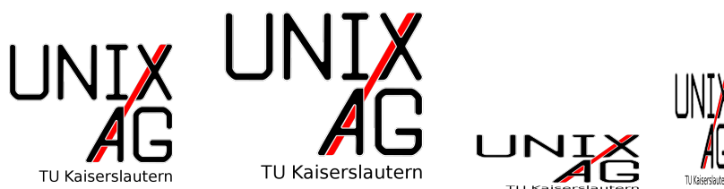
Abbildung 1: Logos, von links: width=3cm, height=3cm , width=3cm,height=1cm , width=1cm,height=2cm

Wird \includegraphics zum Einbinden von PDFs genutzt, bietet die Option page die Möglichkeit, eine spezielle Seite einzubinden. Dies ist Abbildung 2 demonstriert.