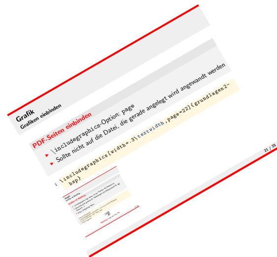
Abbildung 3: Rotierte Seite aus dem Vortrag