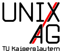
Abbildung: Unix AG der TU Kaiserslautern

1 \begin{frame} 2 \begin{figure} 3 \includegraphics[height=3cm]{UnixAG} 4 \caption[fig:UnixAG]{Unix AG der TU Kaiserslautern} 5 \end{figure} 6 \end{frame}