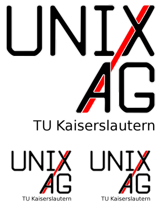
Abbildung 1: Normale Abbildung mit drei Grafiken