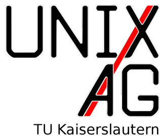
Abbildung 3: Eine wrapfigure

In \LaTeX werden Grafiken üblicherweise als Gleitobjekt gesetzt. Fügt das Unix-AG-Logo in diesem Abschnitt in verschiedenen Weisen ein: Abbildung 1 zeigt das Logo einmal in einer Breite von 5 cm und darunter zwei Mal in einer Breite von 2 cm, Abbildung 3 fügt das Logo an dieser Stelle als wrapfigure (Breite: 5 cm)