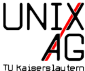
Abbildung: Unix AG der TU Kaiserslautern

1 \begin{frame} 2 \begin{figure} 3 \includegraphics[height=3cm]{UnixAG} 4 \caption[fig:UnixAG]{Unix AG der TU Kaiserslautern} 5 \end{figure} 6 \end{frame}