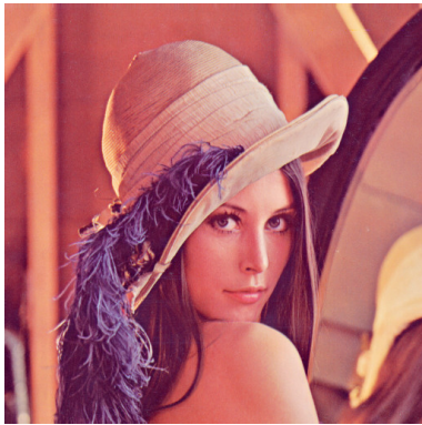
Abbildung 3: Wrapfigure

elit. Duis fringilla tristique neque. Sed interdum libero ut metus. Pellentesque placerat. Nam rutrum augue a leo. Morbi sed elit sit amet ante lobortis sollicitudin. Praesent blandit blandit mauris. Praesent lectus tellus, aliquet aliquam, luctus a, egestas a, turpis. Mauris lacinia lorem sit amet ipsum. Nunc quis urna dictum turpis accumsan semper.